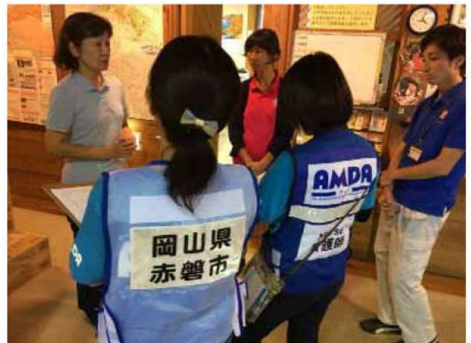
房総半島台風支援活動