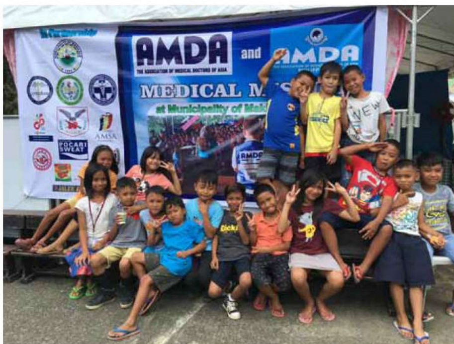
フィリピンミンダナオ島地震被災者緊急支援活動 医療支援活動地での子どもたち (2019.11)

2019年度も国内外で多くの自然災害が発生しました。日本各地でも台風や洪水などの水災害に見舞われ、AMDAは2018年の「西日本豪雨災害被災者緊急支援活動」で得た知識や経験をもとに、病院支援を含む医療支援、災害鍼灸支援など多岐にわたる支援活動を実施しました。