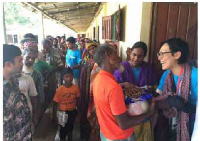
バングラデシュ北部洪水緊急支援活動 物資支援