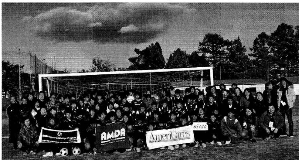
AMDA 東日本大震災復興支援 気仙沼市立津谷中学校で開催したスポーツ親善交流プログラム

平成 25 年度も、東日本大震災復興支援事業として、岩手県上閉伊郡大槌町の AMDA 大槌健康サポートセンター、宮城県南三陸町の志津川病院、宮城県石巻市雄勝地域などを拠点に様々な活動を実施しています。皆さまの温かいお気持ちを被災地に届けます。