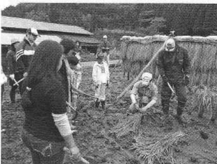
収穫祭ではたくさんの方が稲刈りを体験