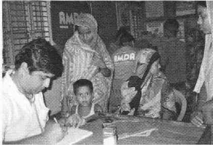
巡回診療に訪れた親子