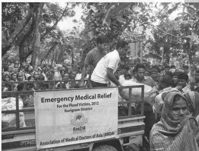
バングラデシュ洪水緊急医療支援活動で物資提供に集まる人々 2012.71

平成 24 年度も多くのみなさまの温かいご支援により様々な事業を実施することができました。 ここに感謝とともにご報告いたします。