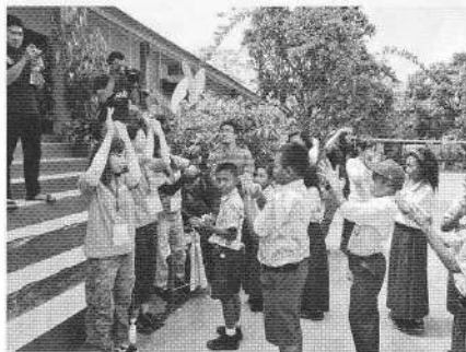
小学校で手洗いの講習を行う塾生ら

◇実施場所 (国内研修) 岡山市 (海外研修) インドネシア スラウェシ島、バリ島