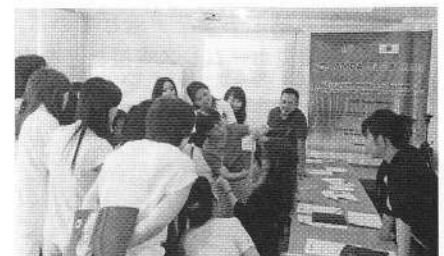
子どもの弱視治療セミナー