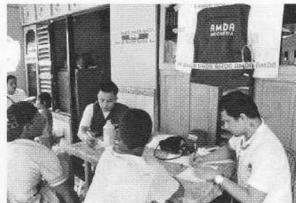
インドネシア支部医師による診療