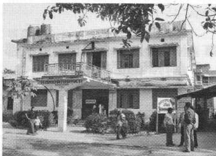
リフェラルヘルスセンター

ブータン難民と地元住民の双方を医療支援対象とした事業として、1992 年から、メチ県ジャバ郡ダマックで AMDA ネパール支部を実施主体として継続している。現在事業は、小児科病棟や HIV/ 感染症予防事業、難民キャンプ内ヘルスケア事業、人材育成など他分野にわたる。