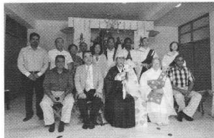
AMDA ピースクリニック開院4周年式典