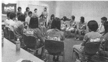
東日本からのゲストを交えて報告会

県内の高校生を中心に、36 人が、ほぼ毎月 1 回、AMDA 本部事務所に集まり、行事の計画や打ち合わせ、学習会を行った。活動は昨年度に続き東日本大震災復興支援、「同世代間交流」を中心に進めた。