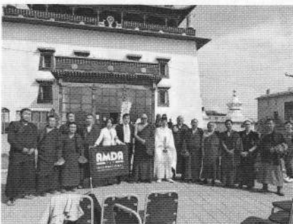
ガンダン寺の前で参加者とともに