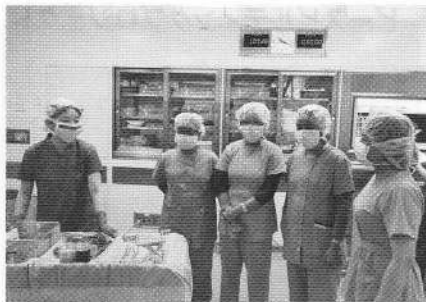
病院でトレーニングを受ける様子