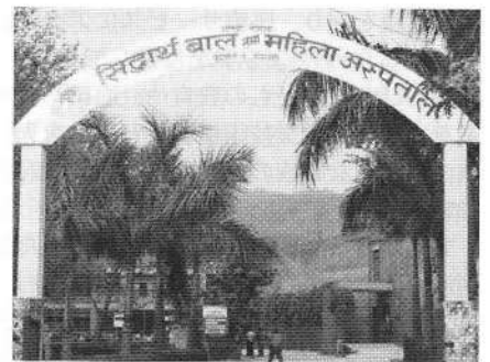
ネパール子ども病院

1998 年 11 月、阪神淡路大震災後の日本とネパールの多くの支援者の方々の協