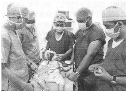
インドネシア医師による口唇口蓋裂手術