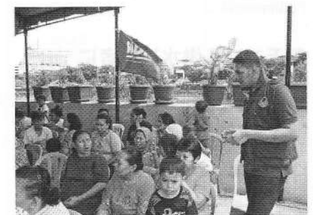
診察を待つ人々に声をかける心理士