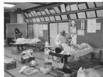
雄勝町では巡回で鍼灸治療を実施

健康支援事業としては、上閉伊郡大槌町設置したAMDA大槌健康サポートセンターで心身の健康支援をテーマに、コミュニティスペースを活用し、人々の笑顔が集う場所の提供を行っている。さらに同施設内にある鍼灸室と石巻市雄勝町では鍼灸治療支援を実施しており、高齢化が進む被災地において、非常に喜ばれている。