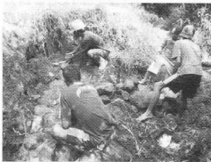
寄贈した資材で水路の復旧を行う様子