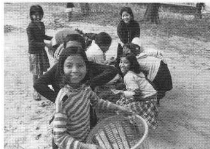
清掃活動をする子供たち