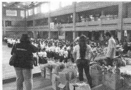
子どもたちに物資を配布

◇現地での参加者を含めた事業チーム構成 AMDA派遣者を含む地域のボランティアなど