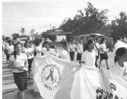
世界 AIDS デーにイベントを開催

AMDA カンボジア支部では、2012年度、「HIV/AIDS プロジェクト」「マラリア予防プロジェクト」の2つのプロジェクトを去年に引き続き実施した。