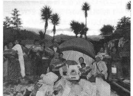
被災した一家にテントと寝袋を提供

◇実施場所 グアテマラ共和国 トトニカパン県 ツァニスナン村、メディア・クエスタ村、チメンテ村、マクスル村