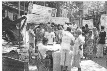
焼かれた寺院跡地での診療活動