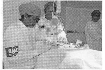
無料白内障手術の様子