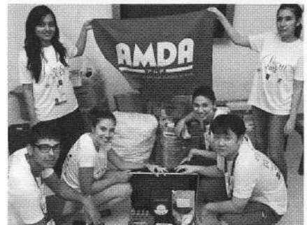
プロジェクトスタッフとともに