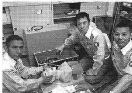
救急処置の訓練の様子