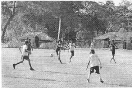
サッカーを行う男子学生ら