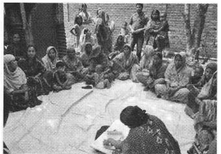
マイクロクレジットの会合を行う村の女性達

1999 年、AMDA 本部による資金援助を元に始まり、AMDA バングラデシュ支部が主体で実施するものである。特に、女性達が小規模融資 (マイクロクレジット) の利用を通して経済的に自立し、家