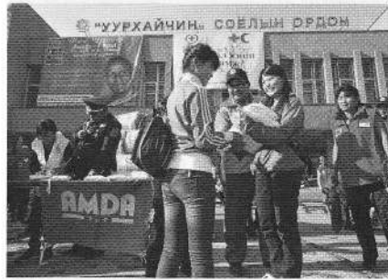
支援物資贈呈式の様子

ランバートル本部スタッフ5名(災害対策部長、ソーシャルプログラム部職員1名、企画部職員2名、オーストラリア赤十字からのボランティア1名)