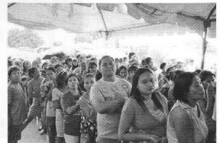
物資配布に詰めかけた人々