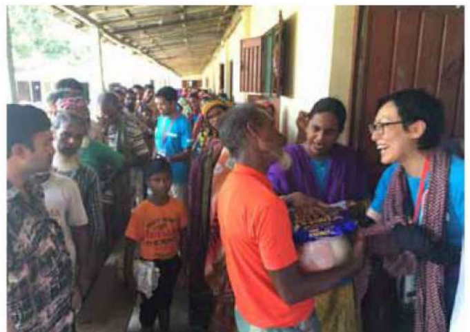
バングラデシュ北部洪水緊急支援活動 物資支援