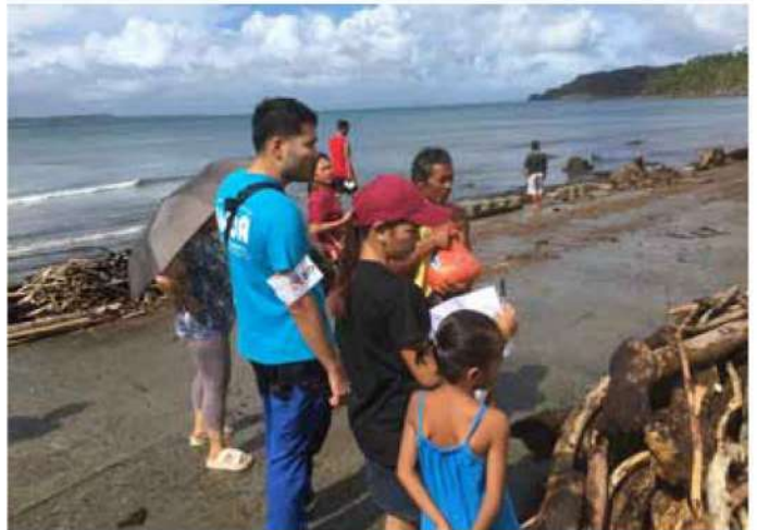
フィリピン・台風28号被災者緊急支援活動 被災地を回りながら物資を渡す AMDA 調整員