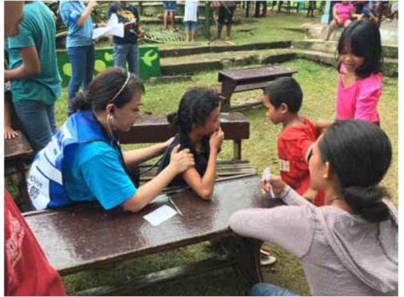
フィリピン・ミンダナオ 地震被災者緊急支援活動 医療支援