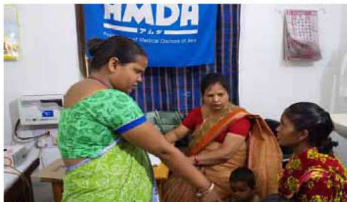
インド・AMDA ピースクリニック