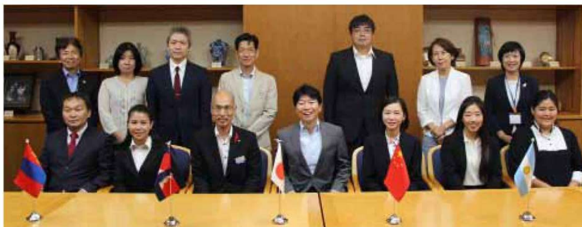
モンゴル人研修医 (岡山県庁にて、写真左下)