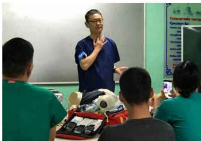
モンゴル・救命救急 医療技術支援移転事業