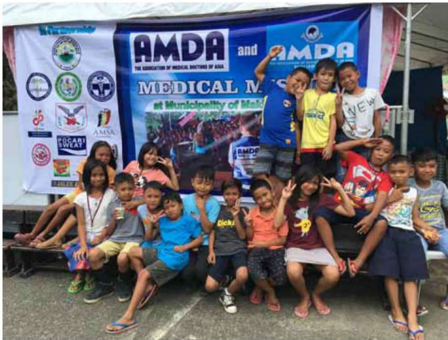
フィリピンミンダナオ島地震被災者緊急支援活動 医療支援活動地での子どもたち (2019.11)

2019年度も国内外で多くの自然災害が発生しました。日本各地でも台風や洪水などの水災害に見舞われ、AMDAは2018年の「西日本豪雨災害被災者緊急支援活動」で得た知識や経験をもとに、病院支援を含む医療支援、災害鍼灸支援など多岐にわたる支援活動を実施しました。