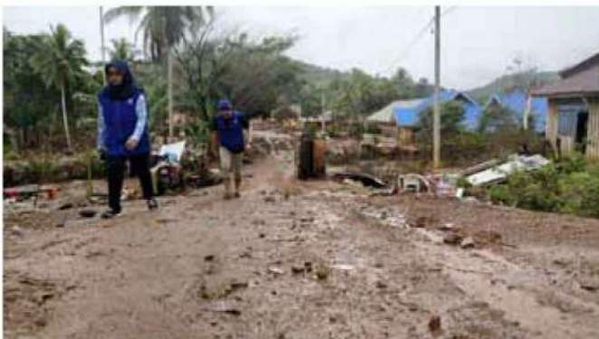
インドネシア・スラウェシ島洪水被災者緊急支援活動