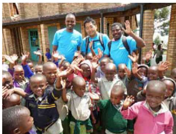
ルワンダ学校健診