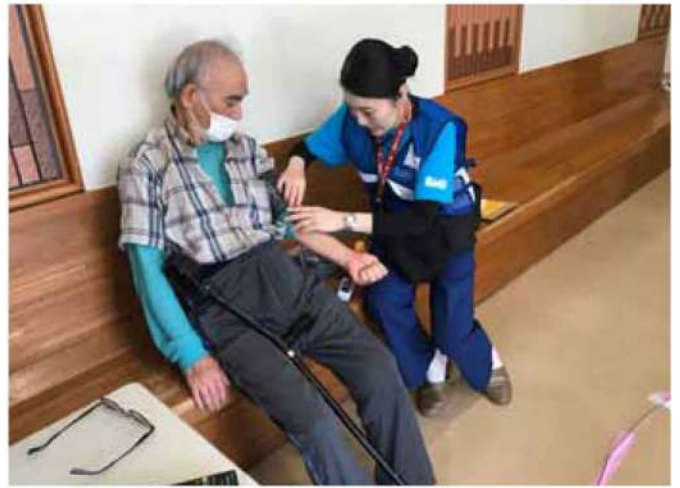
福島県 スポーツアリーナ相馬（避難所） 避難者の健康面の見守りを行う AMDA 看護師