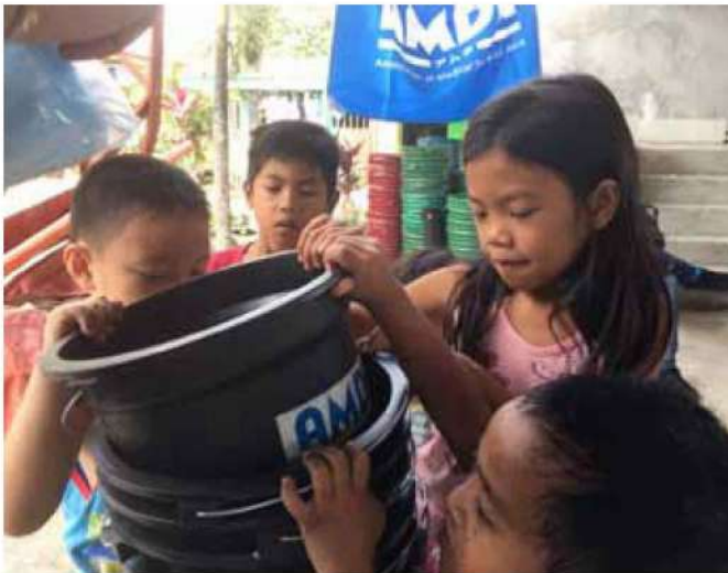
フィリピン・タール火山噴火被災者緊急支援活動 AMDAの支援したバケツを受け取る子どもたち