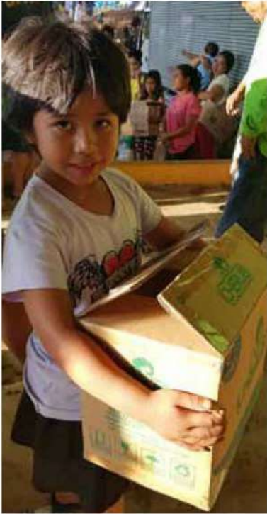
フィリピン・ミンダナオ 物資を受け取った女の子