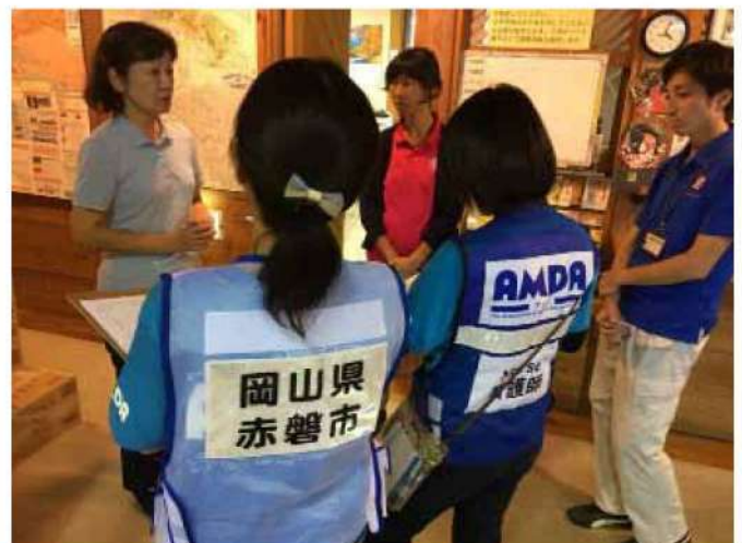
房総半島台風支援活動