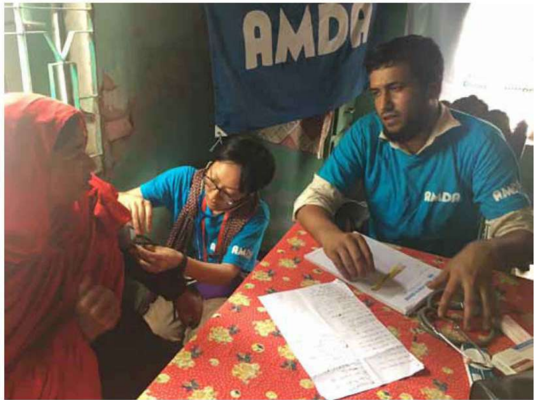
Bangladesh北部洪水被災者緊急支援活動