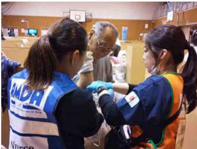
宮城県 丸森小学校避難所で避難者の傷口を確認する AMDA 看護師