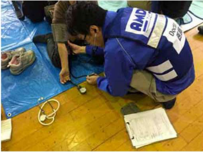
長野市内の避難所を巡回する AMDA 医師