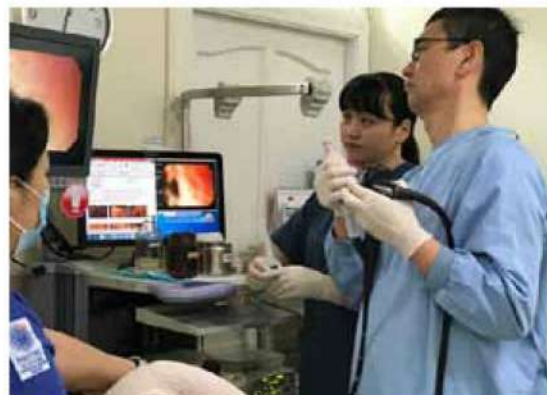
モンゴル・AMDA 内視鏡技術移転事業