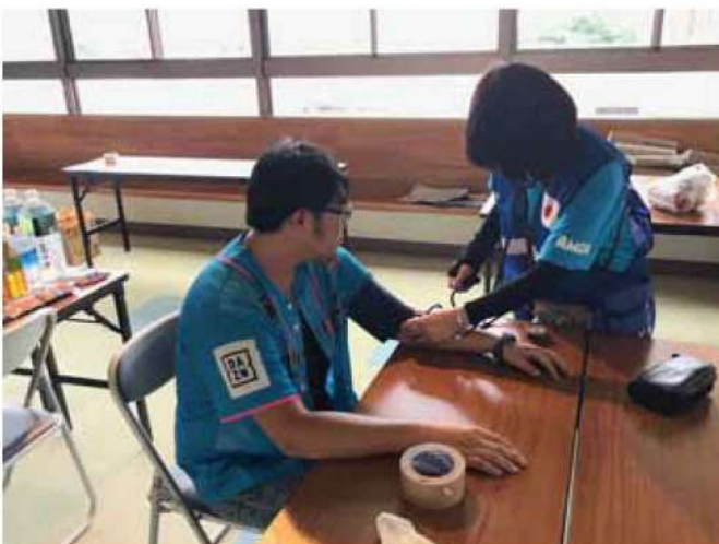
避難者及びボランティアの健康相談を受ける AMDA 看護師