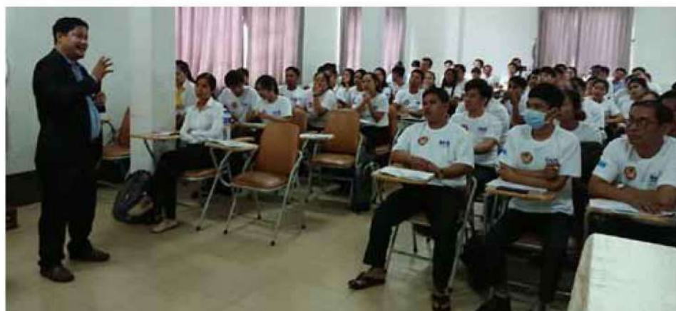
カンボジア・青少年フォーラム