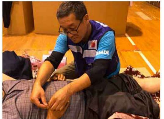
宮城県丸森小学校での災害鍼灸の様子