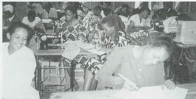
ケニアABC (女性自立支援) プロジェクト