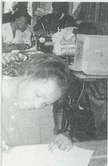
自立支援)プロジェクト

*マークのついたプロジェクトは現在活動中です。 プロジェクト活動の継続と充実のために、みなさん のご支援をお待ちしています。