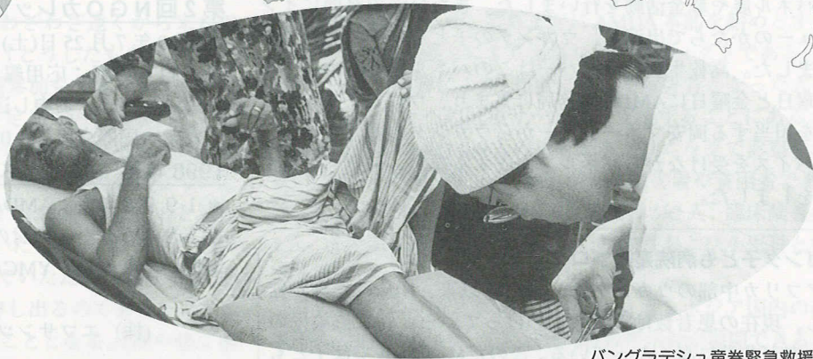
バングラデシュ竜巻緊急救援

日本・台湾・韓国・マレーシア・ パル・タイ・バングラデシュ・ ンカ・スーダン・ブラジル・ ンビア