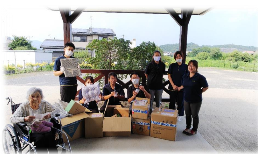
AMDAからの支援物資を受け取った 菜の花の皆様

被災して物資を入手するのは大変困難になっていきます。また物が売ってあっても被災され金銭的に余裕がない方は購入が難しい現状です。そのような中、ご支援頂いたおかげで、そういった方が非常に助かっておられます。これもひとえにAMDA様のご尽力の賜物と、御礼申し上げます。