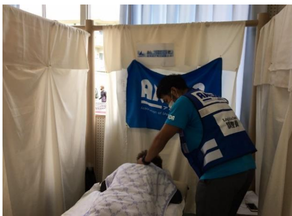
平野柔道整復師による 避難者への施術