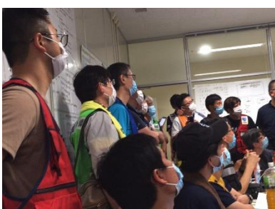
人吉市医療調整会議(下)

当日夜より球磨村の避難所である「さくらドーム」にて活動を開始。熊本県にも登録の上、主に以下の活動を実施。AMDAからは医師等11人を派遣した。