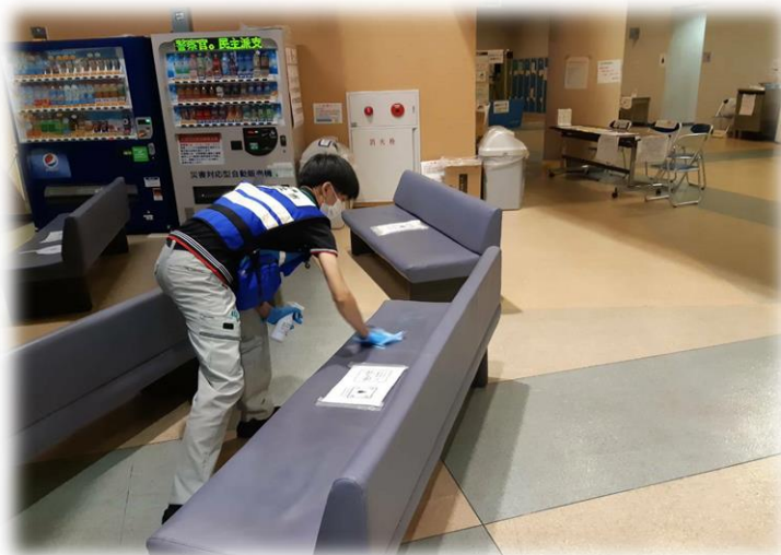
人吉スポーツパレスでコロナ対策を担当した総社市職員