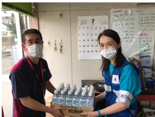
経口補水液を渡す 高看護師