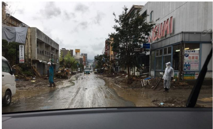
災害発生時の熊本県人吉市の様子

その後、熊本県・球磨川が氾濫し、同県南部を中心に洪水が発生した。6日時点で死者20人、住宅被害242棟が確認されていた(内閣府発表)。この深刻な状況を受け、熊本県熊本市からの連携支援要請を受けた岡山県総社市より、AMDAへ医療チームの派遣要請があった。同月6日、AMDAより医師1人、看護師2人、調整員(岡山県赤磐市職員)1人を含む、「総社市・赤磐市・AMDA 合同チーム」は熊本県人吉市に向け出発した。