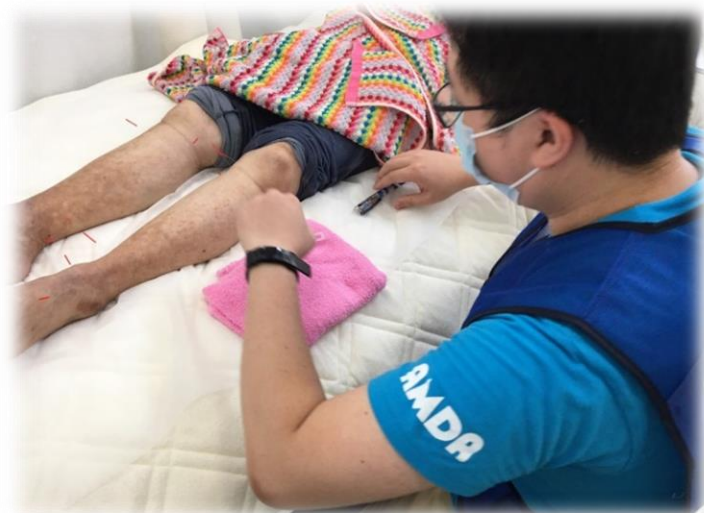
被災者に施術を行う 灰床鍼灸師

そのような思いで現地に入りましたが、先に入っておられた先生方のお力もあってか徒労に終わりました。被災者さんの強さに感動を覚えるくらいでした。