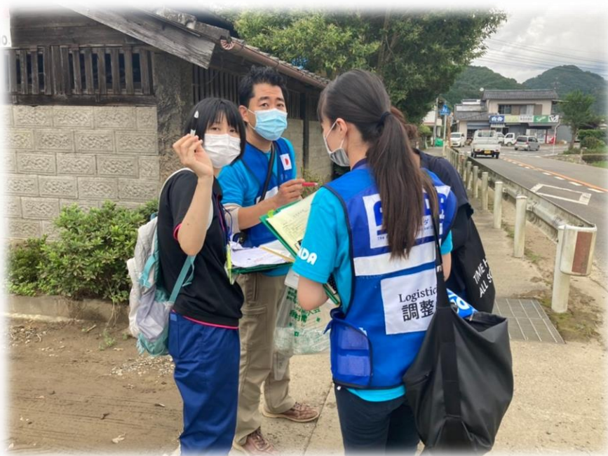
相良村で保健活動を行う地元保健師とAMDA派遣者

実は、私も1997年にAMDAより Bangladesh のサイクロン被害支援活動、ミャンマーでの保健活動に派遣して頂きました。その時の経験が、その後の私の公衆衛生人生の大きな礎となっています。今後のAMDAの益々のご発展をお祈り申し上げます。