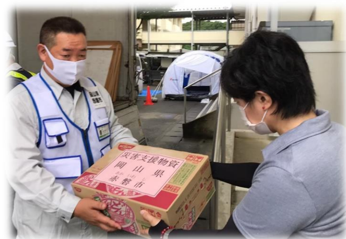
支援物資を渡す赤磐市職員

球磨村を始めとしてこの度の豪雨災害に遭われた方々におかれましては、自身の健康に十分留意され、1日も早い復旧・復興を祈念いたします。