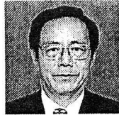
岡山県知事 石井正弘

岡山県に本部を置くAMDAは、NGOとしての特性を生かした緊急救援、医療、保健衛生など数々のプロジェクトを幅広く展開されており、その活動は世界的に高く評価されているところであります。