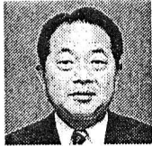
岡山市長 安宅敬祐