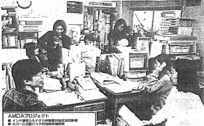
▲ AMD Aの本部。人道援助を世界に発信する

AMD A 本部は岡山市東区西(西暦1980年代)の個人医院(旧住居)にあり、そのなかに高い天井と電話が並ぶのは、遠くから来ると驚かす。AMD Aの本部は、世界をめぐり、世界中の人道援助活動を支えている。AMD Aの本部は、世界中の人道援助活動を支えている。AMD Aの本部は、世界中の人道援助活動を支えている。