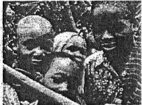
ルワンダ難民の子ども。明らかに栄養失調の症状がみられる。

「AMD Aの本部は、世界中の人道援助活動を支えている。AMD Aの本部は、世界中の人道援助活動を支えている。AMD Aの本部は、世界中の人道援助活動を支えている。」