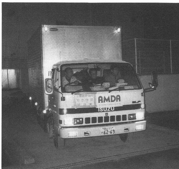
図3 AMDA本部を出発する物資輸送シャトル便

師たちに返すことを決定した。地震発生の日12日に神戸市長田区医師会長、13日に神戸西市民病院長と面会した。趣旨は緊急医療から日常医療への移行のお願いであった。結論として長田区役所内24時間診療所に14日より神戸西市民病院より医師1名と看護婦1名を派遣していただきAMDАのボランティア医師、看護婦と薬剤師は両名の管轄下に入ることになった。業務移行は順調に進み、18日目の2月4日には長田区役所内診療所でのAMDАボランティアによる医療業務は完全に終了した。以後診療所は西市民病院のスタッフによって運営されている。2月16日には1カ月に及ぶ全活動から撤収した。