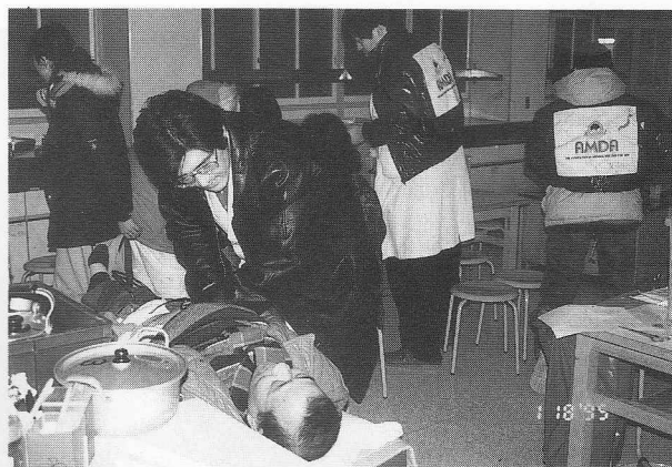
図1 神戸長田区避難所で診療する AMDA スタッフ