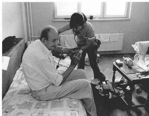
戸別訪問診療をおこなうAMDAチーム (ボスニア)