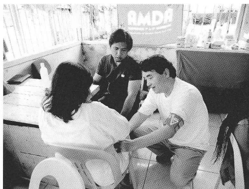
フィリピン台風30号 巡回診療を行うAMDAチーム