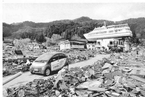
総社市提供の電気自動車が災害被災地で大活躍 NYタイムズ紙にも紹介された