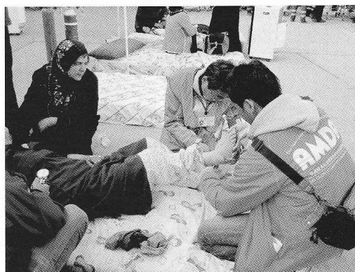
トルコ・エルジシュの体育館で治療を行う様子