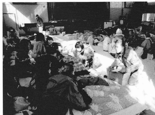
避難所などで巡回診療を実施（東日本大震災）