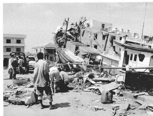
スマトラ沖地震津波被災地（インド）