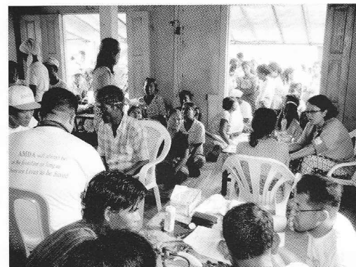
ミャンマーサイクロン被災地避難所寺院での診療