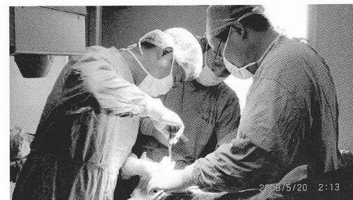
AMDA台湾支部の外科医による手術 （四川大学華省病院、成都市）