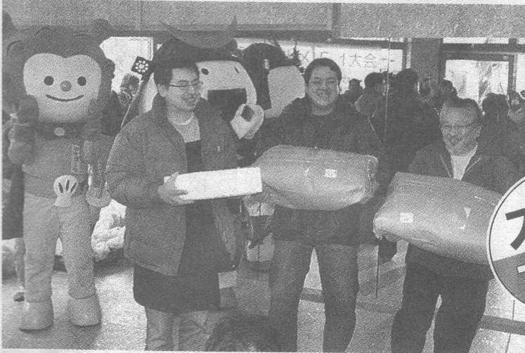
▲優勝賞品の米などを受け取る「南町紫市場」メンバー