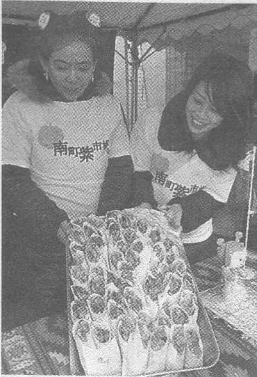
▲好評だった「気仙沼サンマテイヤ」