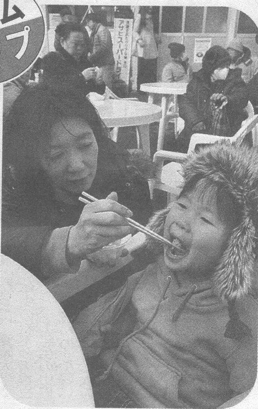
「おいしいね」。ご当地グルメに大満足