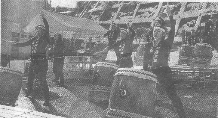
▲花を添えた八幡太鼓の演奏