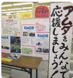
コープでパネル展