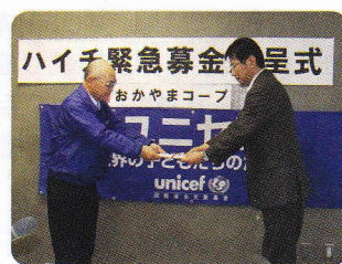
ハイチ緊急募金贈呈式