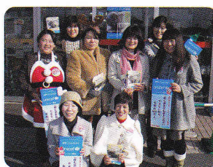
コープ店頭でハンド・イン・ハンド

おかやまコープは1984年から2009年度までに、寄せられた約1億4千7百万円の募金をユニセフに贈呈しています。