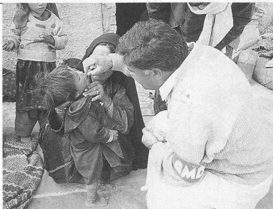
多国籍医師団によるパキスタンのアフガン難民キャンプでの巡回診療と保健支援（子ども達への予防接種授与）

ならず多数の若い医療従事者が応募してくれた。現在もアフガニスタンの国境にあるクエッタを中心に国連高等難民弁務官事務所と契約して難民キャンプでの巡回診療を展開している。NGOは「命の普遍性」を大切にする活動を実施している。人を自殺させない。人を野垂れ死にさせない。そのために緊急人道援助、地域保健医療そして貧困対策のプログラムを用意している。地域保健医療はネパール、カンボジアそしてミャンマーに医療機関を設立して運営している。貧困対策として職業訓練や小規模融資（起業を支援するた