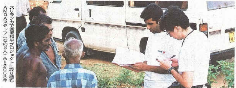
スリランカを平和プロジェクトに取り組むAMD Aスタッフ(右)の中心人物、2000年。

がちとなつていきます。私には失われた人間の尊厳がまだ回復に至っていないように思えます。この尊厳の回復を私の願いです。「戦争は破壊、平和は創造」とあらためて痛感しています。